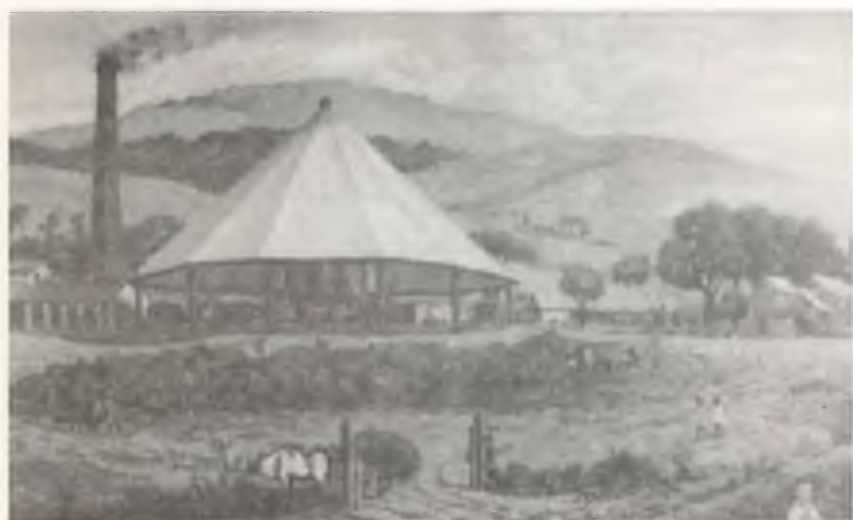
EL TRAPICHE (OLEO SOBRE PANEL 8' x 5')