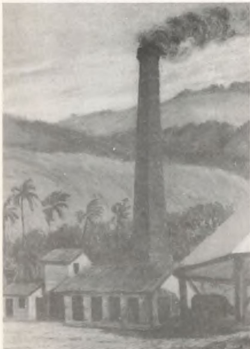
EL TRAPICHE (DETALLE DE LA CHIMENEA)