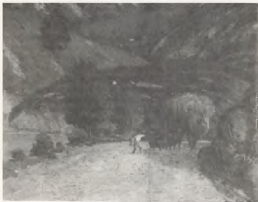
LA CARRETA (DETALLE)