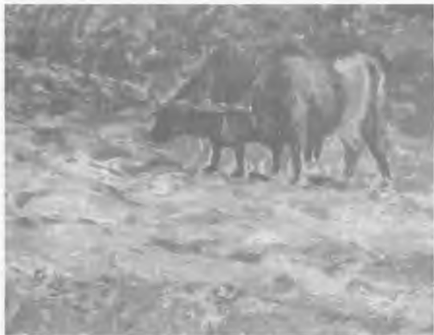
EL TRAPICHE (LOS BUEYES CAUSADOS)