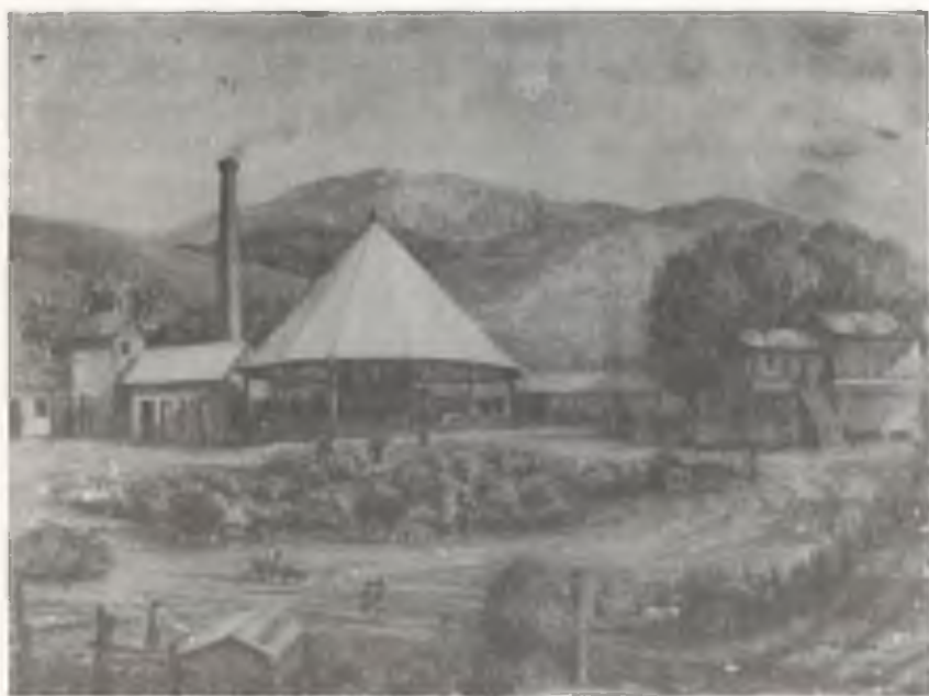
EL TRAPICHE (ACUARELA)