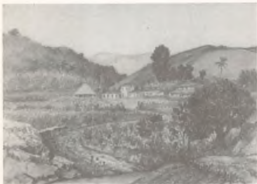
EL TRAPICHE (ACUARELA)