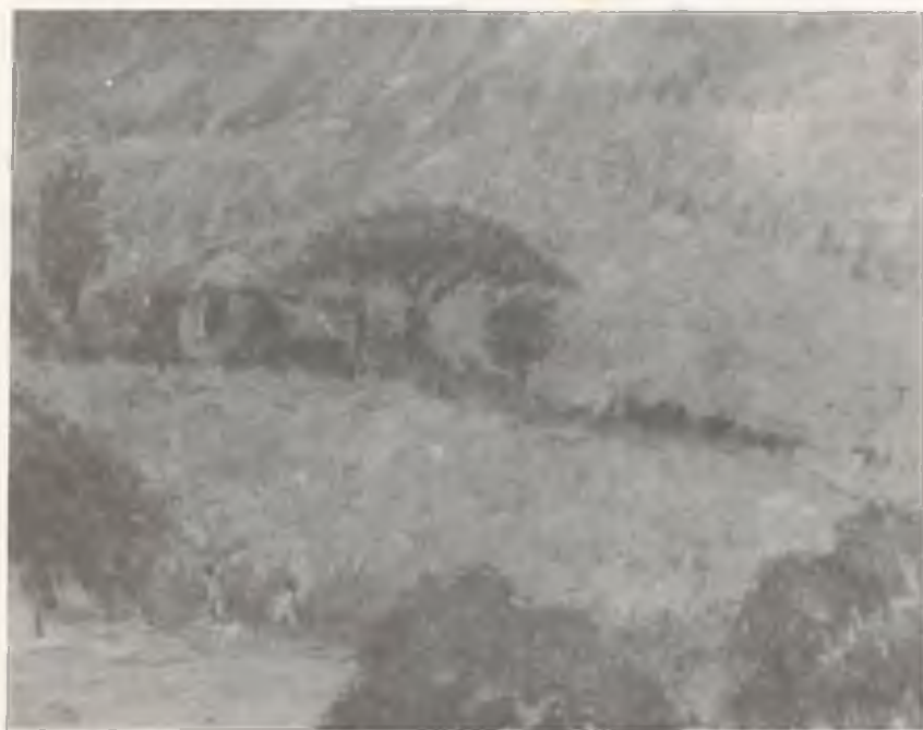
EL TRAPICHE (DETALLE DE BOHIO EN LA LOMA)