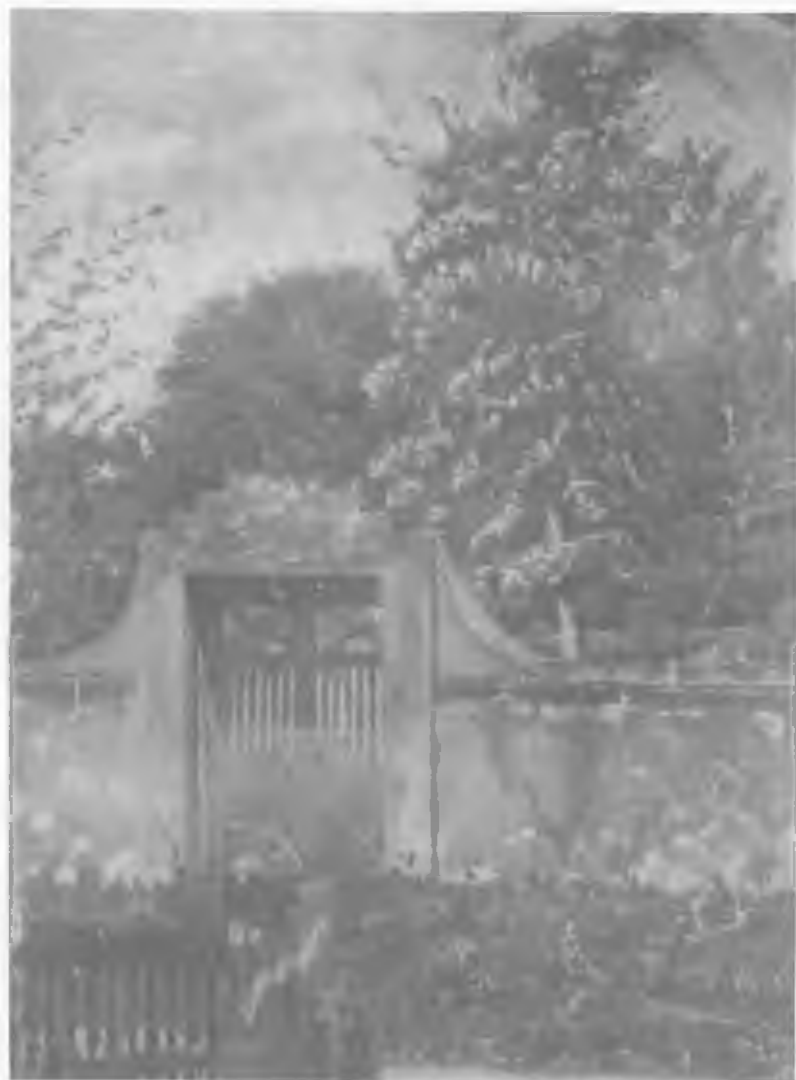
CEMENTERIO VIEJO (OLEO)