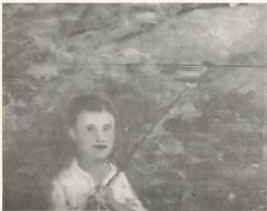
EL TRAPICHE (DETALLE DEL ARTISTA EN SU INFANCIA)