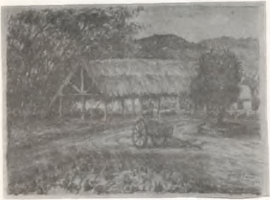
EL RANCHO (ACUARELA)