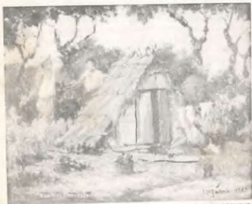
QUE HAY TORMENTA