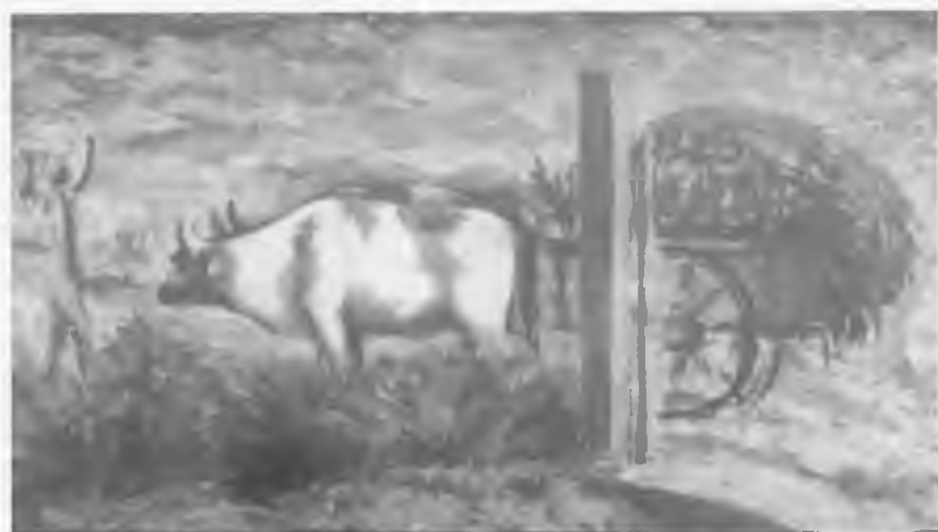
EL TRAPICHE (DETALLE DE LOS BUEYES Y CARRETERO)