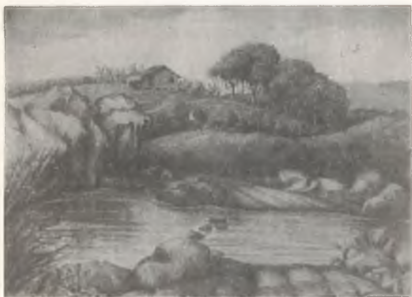
EL ARADO (ACUARELA)